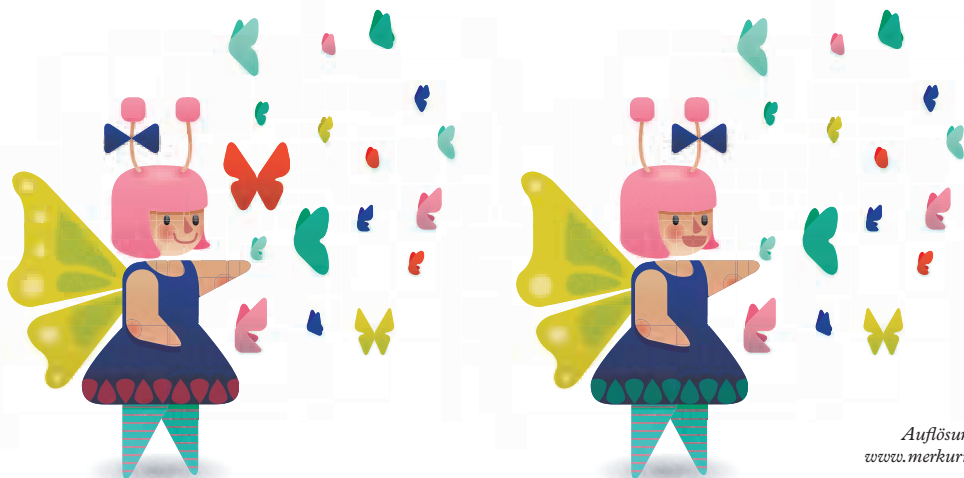
Illustration: Judith Lamberger

Auflösung finden Sie unter www.merkurmarkt.at/Magazin